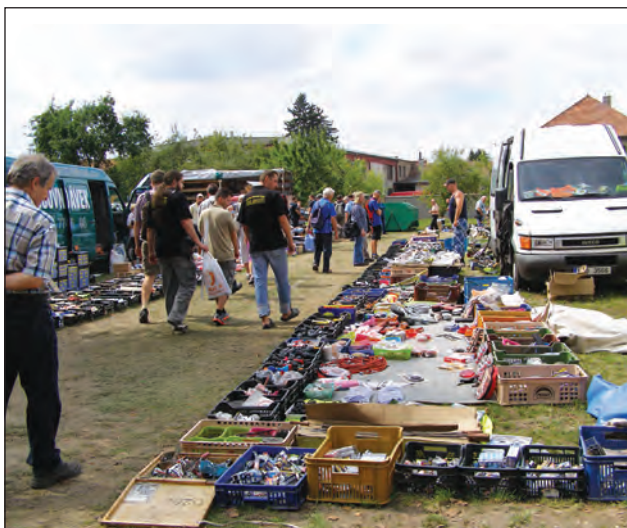
Holické bleší trhy s radioamatérskými „nezbytnostmi“ jsou oblíbené.